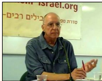
פרופ' יעקב רז